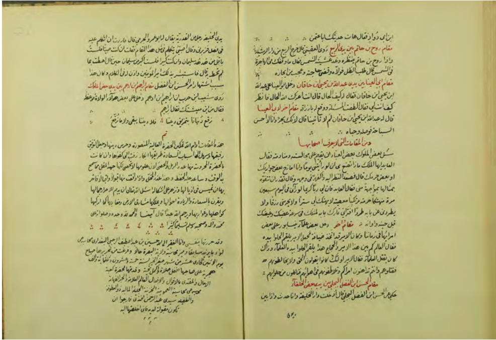
ms Kuwait University 735, fol. 57b–58r