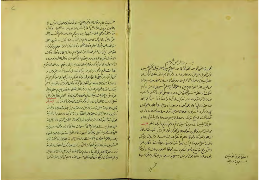
ms Kuwait University 735, fol. 1 v -2 r